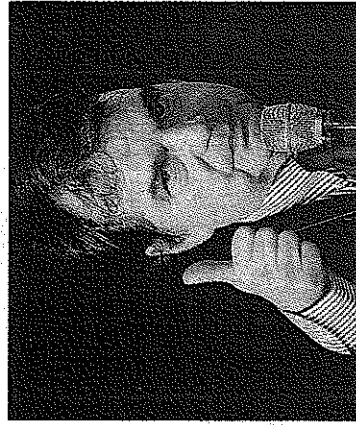
LOTTA Renato Brunetta, il ministro nemico giurato dei cosiddetti fannulloni